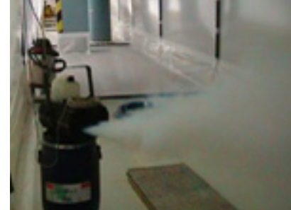
Collaudo con fumogeni

calcolando il tempo di estrazione del fumo.